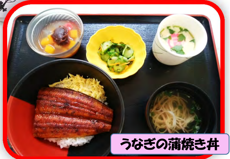
うなぎの蒲焼き丼