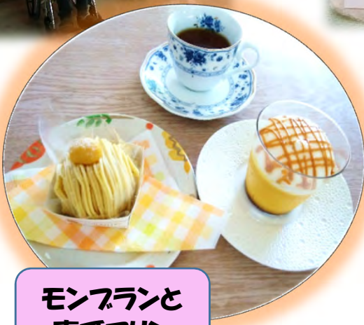
モンブランと 南瓜プリン